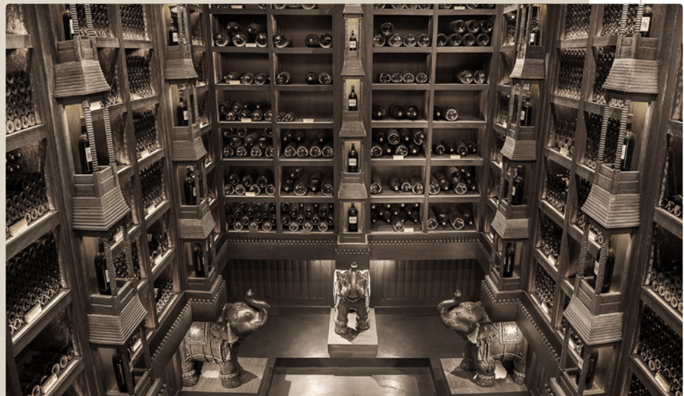
Cos d'Estournel, Saint-Estèphe